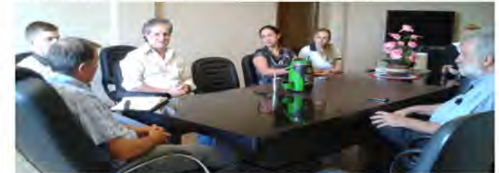
Reunión de trabajo con autoridades y funcionarios municipales

Los proyectos emprendidos en periodos de tiempo pre-electoral tienen el inconveniente del cambio de autoridades, actores clave para la aprobación e implementación del Ordenamiento Territorial. Esta situación ocurrió en la Municipalidad de Mbaracayu y fue uno de los obstáculos para la aprobación completa de la ordenanza de zonificación que fue recortada parcialmente.