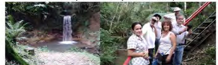
Visita a la Reserva Itavo