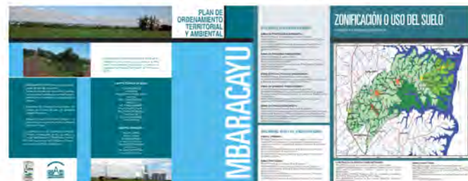
Tríptico del Plan de Ordenamiento Territorial y Ambiental de Mbaracayú