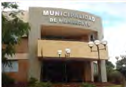
Municipalidad de Mbaracayú

Con esas directivas, se trabajó con las autoridades y funcionarios municipales, primeramente, en un esquema de Plan de Desarrollo, que aunque no estaba en los requerimientos de la solicitud del trabajo, fue necesario plantearlo como guía del Ordenamiento Territorial, ya que finalmente el Ordenamiento Territorial no es más que la concreción física de la visión a futuro del desarrollo pretendido por la población que vive en el lugar.