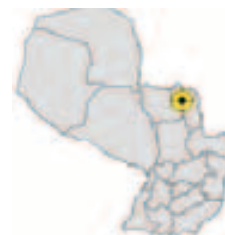
Ubicación del Municipio