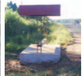
Servicio comunitario-Caseta espera omnibus