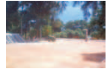
Mejoramiento plaza Defensores del Chaco