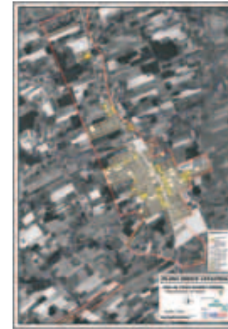
Plano catastral urbano