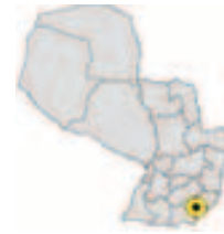
Ubicación del Municipio