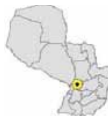
Ubicación del Municipio