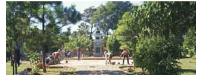
Mejoramiento de la plaza de la Iglesia Inmaculada Concepción