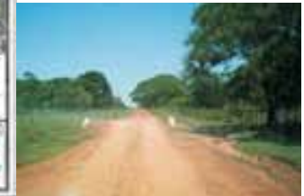
Mejoramiento de caminos Santa Rosa I