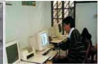
Ajustes al sistema informático