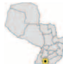
Ubicación del Municipio