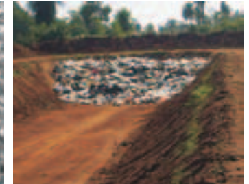
Relleno sanitario municipal