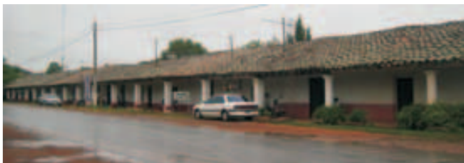
Tirrones de viviendas Jesuíticas - Santa Rosa