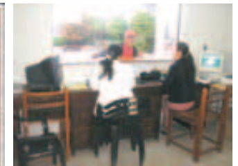
Reuniones del Equipo de Gestión Municipal