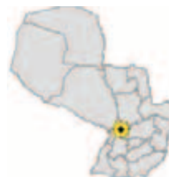
Ubicación del Municipio