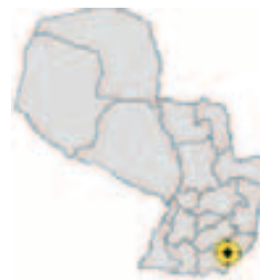
Ubicación del Municipio