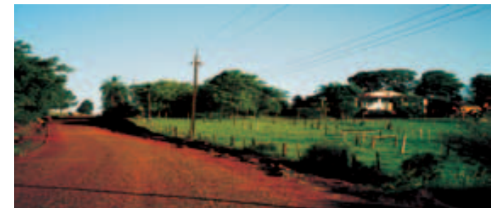
Camino Puerto obligado