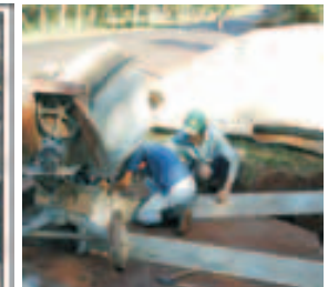
Construcción de alcantarillas y caminos