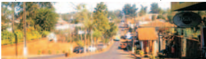
Ciudad de Obligado