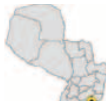
Ubicación del Municipio