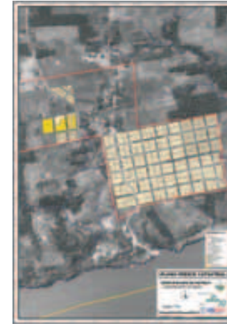
Mapa catastral urbano