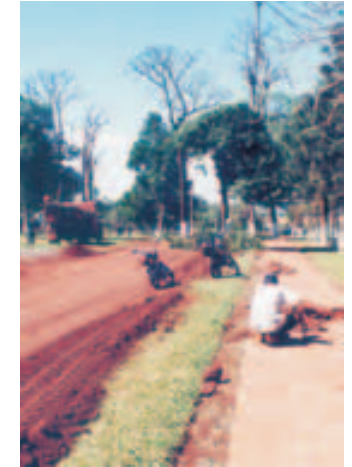
Mejoramiento Avenida Los Lapachos