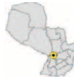
Ubicación del Municipio