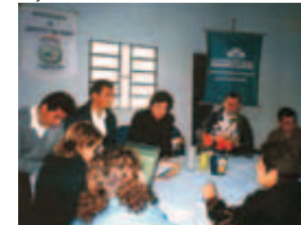
Audiencia pública presupuesto noviembre/05