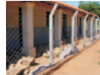
Mejoras de la Escuela 714 Juan E. Jiménez