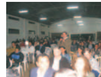
Audiencia pública de rendición de cuentas