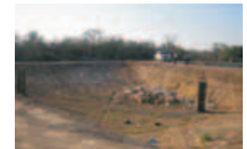
Mejoras en el relleno sanitario de la ciudad