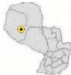
Ubicación del Municipio