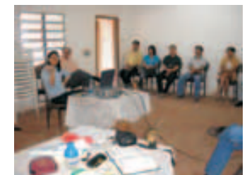
Capacitación a funcionarios