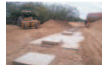
Mejoras en el matadero municipal