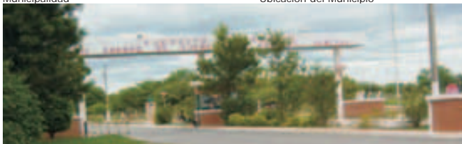
Ciudad de Mariscal José Félix Estigarribia