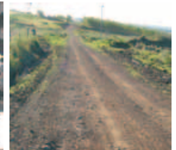
Mejoramiento de caminos vecinales