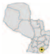
Ubicación del Municipio