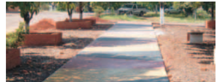
Mejoramiento paseo central Avenida Los Inmigrantes