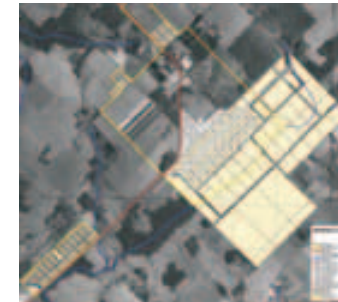
Plano catastral urbano