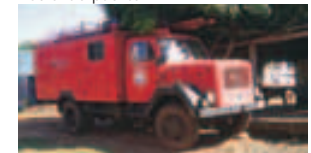
Servicio comunitario-Camión para bomberos