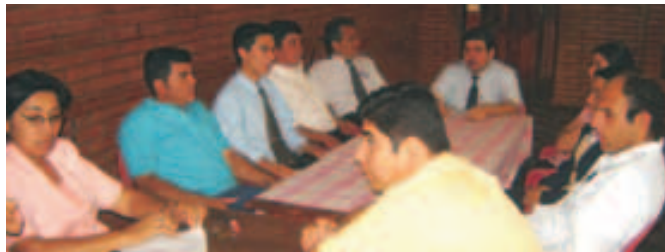
Capacitación a Funcionarios