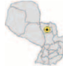
Ubicación del Municipio