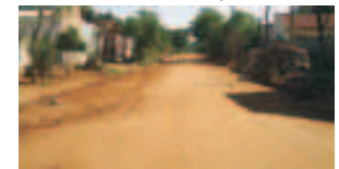
Mantenimiento de calles urbanas