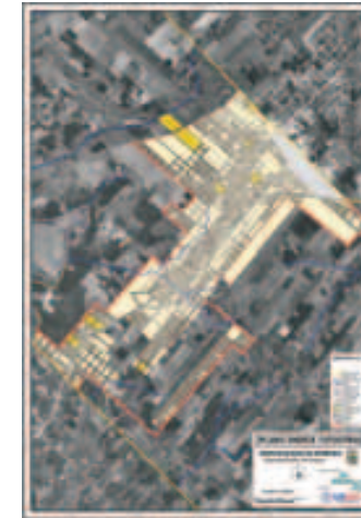
Plano catastral urbano