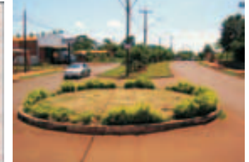
Mejoras en paseo central