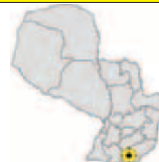
Ubicación del Municipio