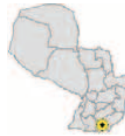
Ubicación del Municipio