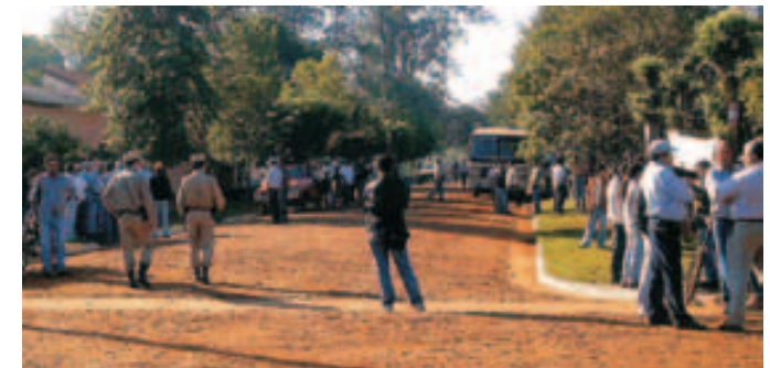
Asamblea de la comunidad