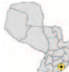
Ubicación del Municipio