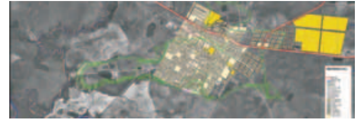
Plano catastral urbano