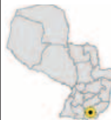
Ubicación del Municipio