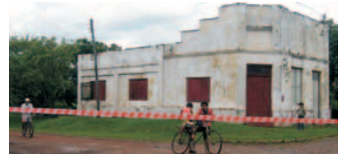
Delimitación zona afectada por el Plan de Terminación de la EBY