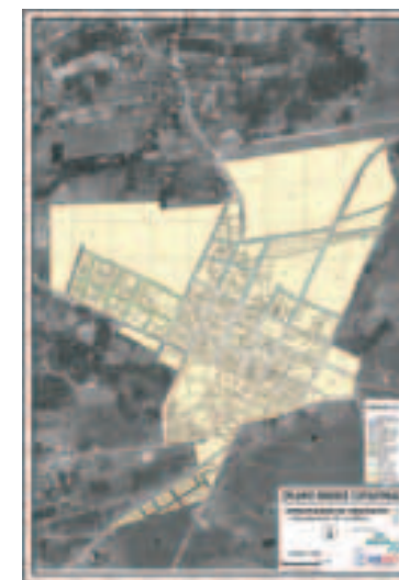
Plano catastral urbano