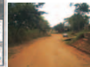
Mantenimiento de camino vecinal