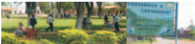
Ciudad de Caraguatay