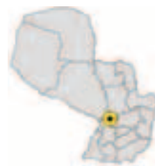
Ubicación del Municipio