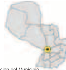
Ubicación del Municipio