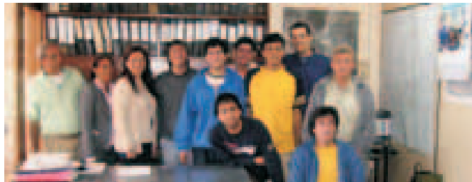
Equipo de Gestión Municipal