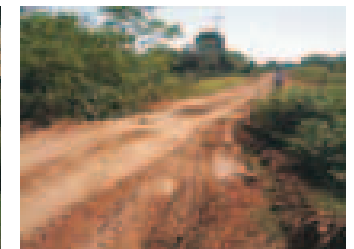
Puente de madera