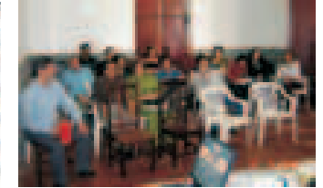
Audiencia Pública, el 30/08/06.