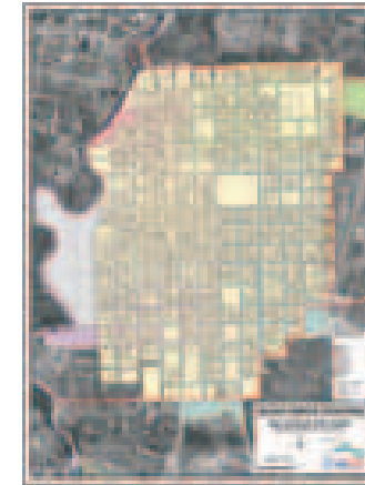
Plano catastral urbano