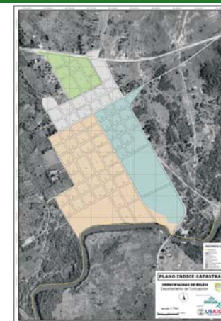
Plano catastral urbano