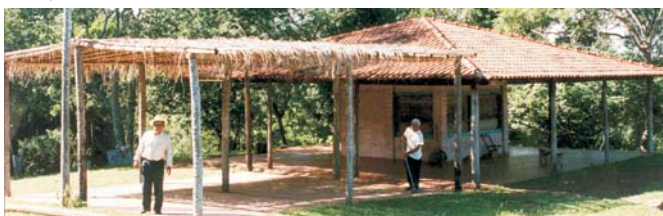
Balneario municipal. Quincho