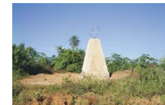
Monolítico Trópico Capricornio