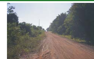
Apertura de camino