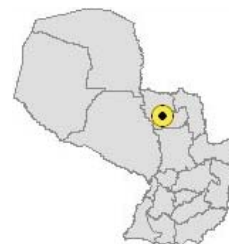
Ubicación del Municipio