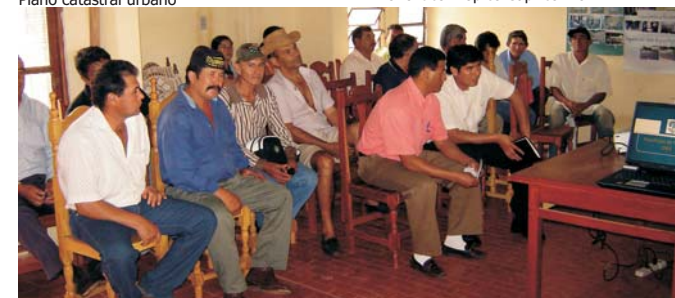
Rendición de cuentas Septiembre 2006