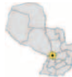
Ubicación del Municipio