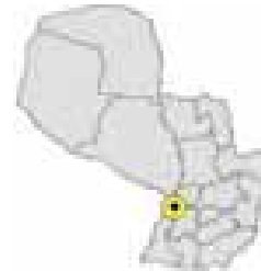
Ubicación del Municipio