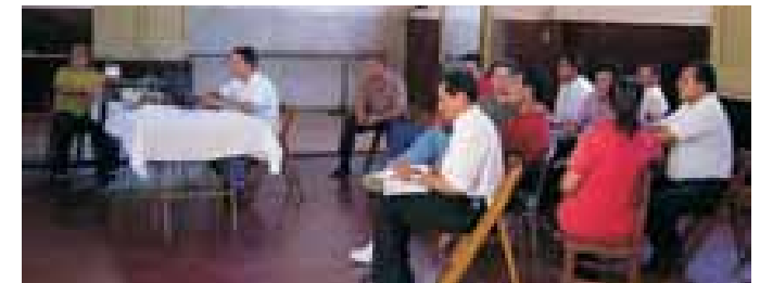
Talleres de Planificación