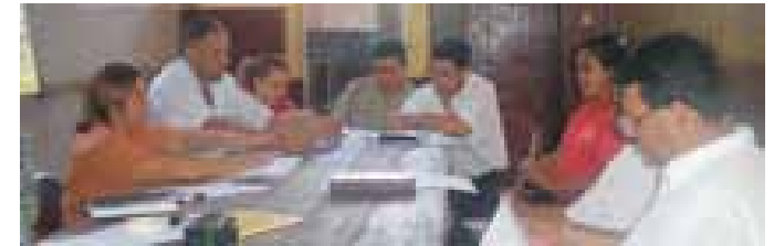
Talleres de Planificación