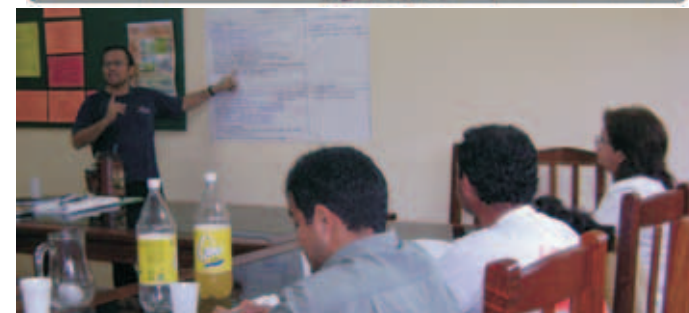
Talleres de diagnóstico y elaboración del plan municipal