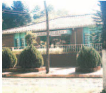
Municipalidad de Yatytay

La implementación del Programa GESTION MUNICIPAL para la optimización del desempeño en la Municipalidad de Yatytay, se realizó a través de acciones municipales de mejoramiento de la gestión financiera, operativa y legislativa, para brindar mas y mejores servicios a la comunidad y promover la participación ciudadana en la construcción de un municipio más eficiente, democrático y transparente.