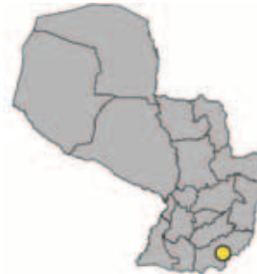
Ubicación Departamento de Itapúa