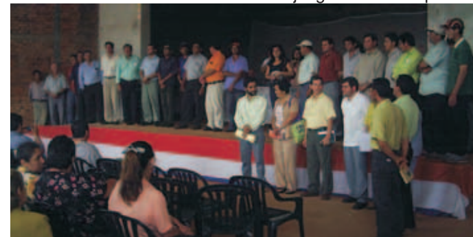
Audiencia pública en Yatytay