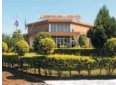
Municipalidad de Santa Rita

Los trabajos se enmarcaron en 5 ejes: financiero, operativo, legislativo de servicios y de participación ciudadana.