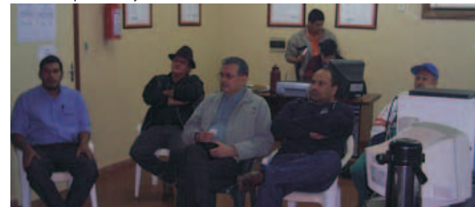
Talleres de capacitación con autoridades y funcionarios