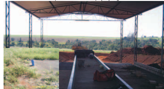
Cinta transportadora y chimenea del relleno sanitario en construcción