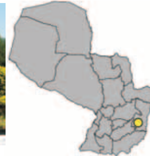
Ubicación Departamento de Alto Paraná