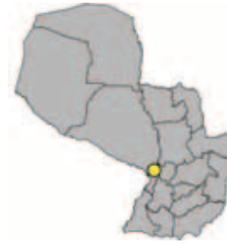
Ubicación Departamento de Cordillera