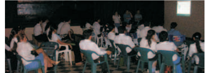
Talleres de diagnóstico y elaboración del plan municipal