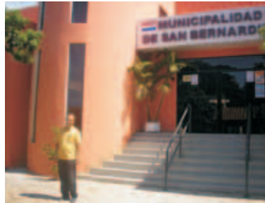
Municipalidad de San Bernardino

La Municipalidad de San Bernardino apuntando a una gestión mas eficiente, democrática y transparente, con la intención de superar las debilidades detectadas, implementó el Programa GESTIÓN MUNICIPAL, optimización del desempeño buscando el equilibrio financiero, la eficiencia operativa, la participación ciudadana y brindar mejores servicios a la comunidad.