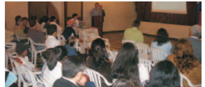
Audiencia Pública de Rendición de Cuentas ejercicio fiscal 2007