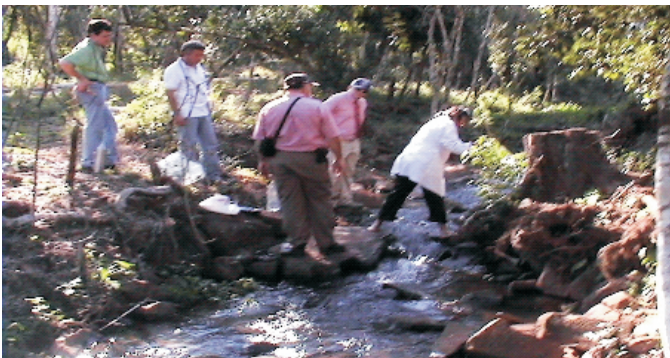
Inspecciones conjuntas con la SEAM (Secretaría del Ambiente)