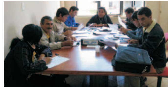
Funcionarios encargados de realizar el censo catastral