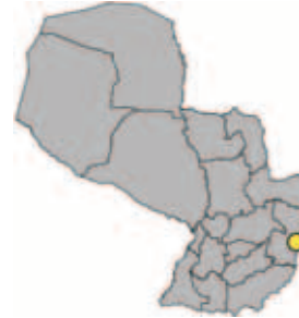
Ubicación Dpto. de Alto Paraná