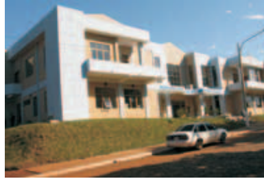
Municipalidad de Presidente Franco

Identificadas las debilidades mencionadas la Municipalidad de Presidente Franco apuntando hacia una gestión municipal mas eficiente, democrática y transparente; acuerda con geAm implementar el Programa de GESTIÓN MUNICIPAL para la optimización del desempeño.