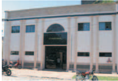
Municipalidad de Paraguari

En ese contexto la Municipalidad de Paraguari, con la intención de trabajar en pro de una gestión mas eficiente, democrática y transparente acordó con geAm la implementación del Proyecto GESTIÓN MUNICIPAL. Para mejorar las debilidades detectadas se trabajaron 5 ejes: financiero, operativo, legislativo, servicios municipales y participación ciudadana.