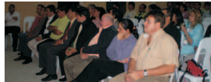
Audiencia pública de rendición de cuentas ejercicio 2007 y 2008