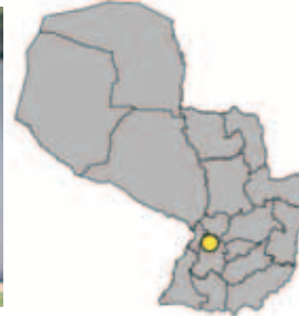
Ubicación del Departamento de Paraguari