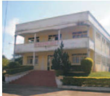
Municipalidad de Juan León Mallorquín

Con la intención de superar las debilidades detectadas, la Municipalidad de Juan León Mallorquín acordó con geAm implementar el Programa de GESTIÓN MUNICIPAL para la optimización del desempeño buscando mejorar la gestión financiera, operativa y legislativa brindando mejores servicios y apuntar hacia una gestión municipal mas eficiente, democrática y transparente.