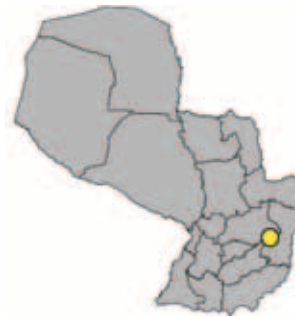
Ubicación Dpto. de Alto Paraná