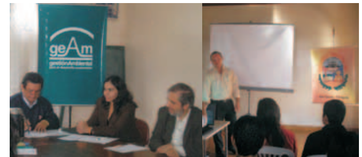
Firma del convenio de asistencia técnica