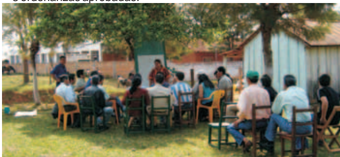
Talleres con las Organizaciones de la Sociedad Civil (OSC)