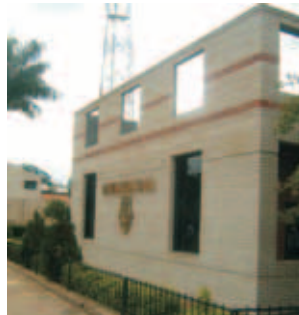
Municipalidad de Coronel Oviedo

Los trabajos se iniciaron con un diagnóstico para luego implementar acciones en cinco ejes: financiero, operativo, legislativo, de servicios municipales y de participación ciudadana.