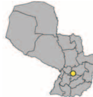
Ubicación Dpto. deCaaguazú