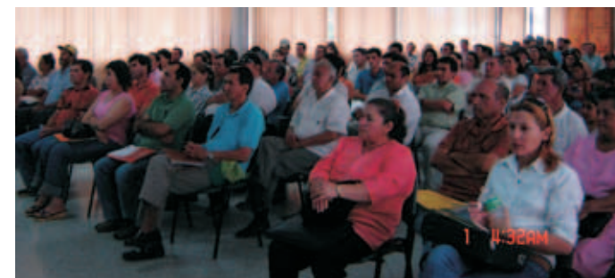
Audiencia Pública de Rendición de Cuentas y Presupuesto Participativo, 2008