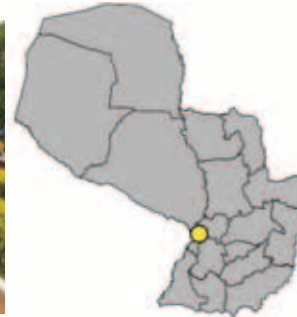
Ubicación Departamento Central