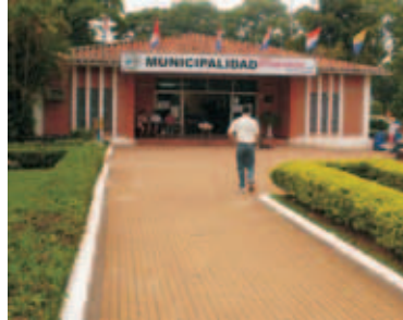
Municipalidad de Capiatá

Para superar las debilidades detectadas se trabajaron 5 ejes: financiero, operativo, legislativo de servicios municipales y de participación ciudadana.