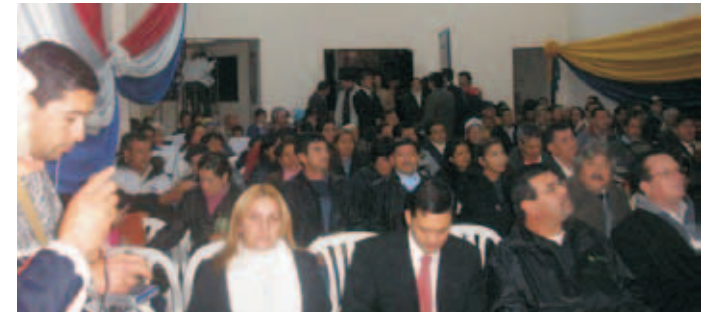
Audiencia pública de rendición de cuentas ejercicio 2007 y 2008