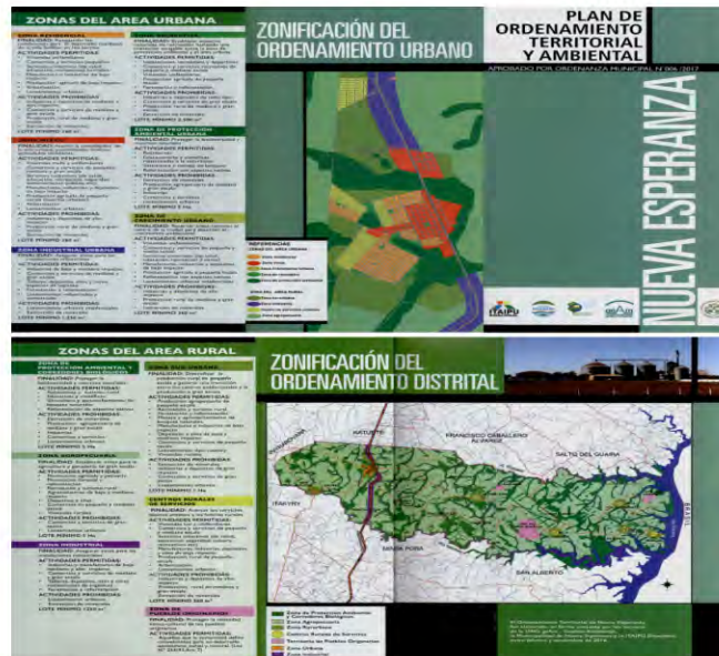
Triptico del Plan de Ordenamiento Territorial y Ambiental de Nueva Esperanza