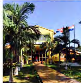
Municipalidad de Nueva Esperanza

La ONG GESTION AMBIENTAL ha sido contratada por ITAIPIU BINACIONAL para elaborar dos planes en el Municipio de Nueva Esperanza: el de Ordenamiento Territorial del distrito y el Plan Director para el área urbana. El trabajo fue realizado en forma conjunta con los técnicos de la Municipalidad de Nueva Esperanza, durante el año 2016 y la Ordenanza que valida los planes, fue aprobada los primeros meses del 2017.