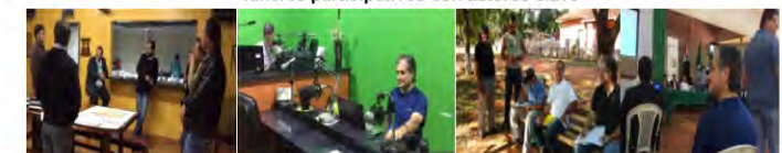
Reuniones y entrevistas a actores clave