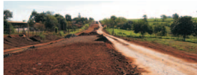
Construcción de empedrado Obligado - Alto Verá