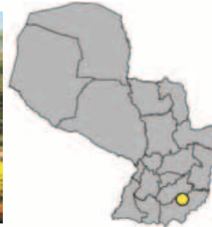
Ubicación Departamento de Itapúa