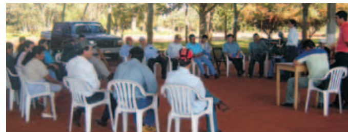
Reuniones de la ODAV