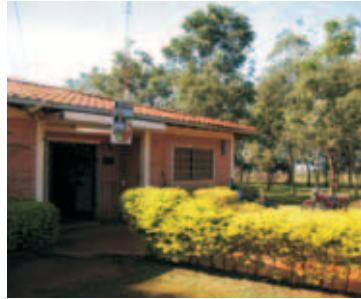
Municipalidad de Alto Verá

La Municipalidad de Alto Verá, con la intención de superar las debilidades detectadas y apuntando a una gestión más eficiente, democrática y transparente acordó con geAm la implementación del programa GESTIÓN MUNICIPAL para el mejoramiento del desempeño institucional en 5 ejes; financiero, operativo, legislativo de servicios y de participación ciudadana.