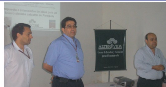
Jornada de difusión de "Propuestas e Intercambio de ideas para un nuevo sistema catastral nacional" en Caaguazú, Caaguazú.