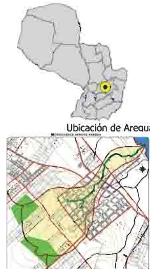
Microcuenca del Arroyo Areguá