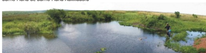
Humedal del Lago Ypacarai