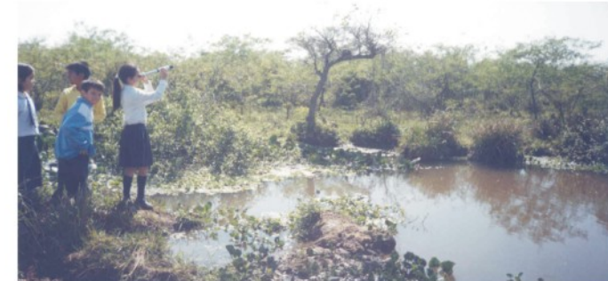
Escolares en caminata de exploración en los humedales