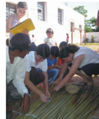
Artesanía en piri (recurso del Humedal)