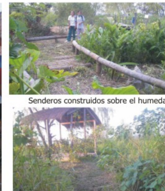
Senderos construidos sobre el humedal