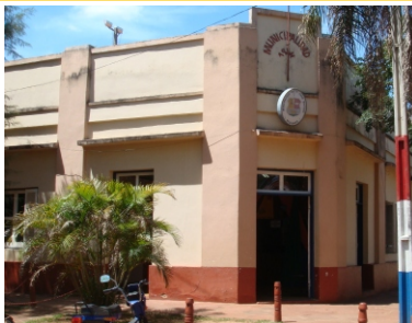
Municipalidad de San Juan Bautista

Esta asistencia fue parte del proyecto GESTION AMBIENTAL del programa BUEN GOBIERNO Y COMPETENCIA POLÍTICA implementado por geAm (Gestión Ambiental para el Desarrollo Sustentable) mediante la cooperación técnica de la Agencia del Gobierno de los Estados Unidos para el Desarrollo Internacional – USAID.