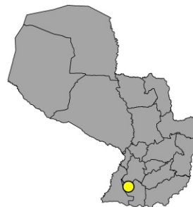
Ubicación Departamento de Misiones