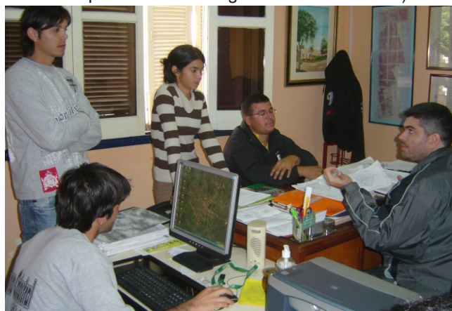
Jornadas de capacitación en gabinete